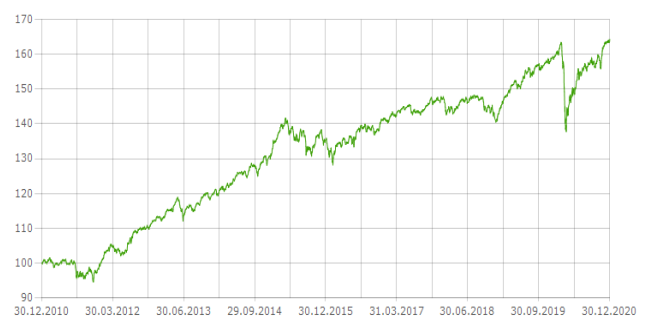
L'andamento negli ultimi dieci anni (*)

(*) L'andamento passato del fondo non è indicativo per il successivo futuro andamento che può quindi differire anche rilevante da questo