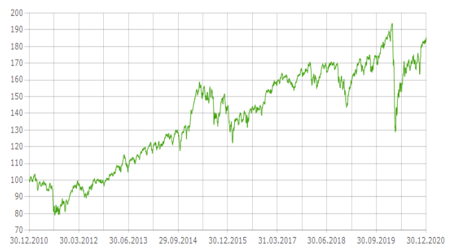
L'andamento negli ultimi dieci anni (*)

(*) L'andamento passato del fondo non è indicativo per il successivo futuro andamento che può quindi differire anche rilevante da questo