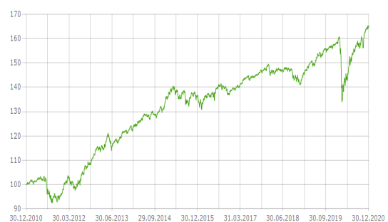
L'andamento negli ultimi dieci anni (*)

(*) L'andamento passato del fondo non è indicativo per il successivo futuro andamento che può quindi differire anche rilevantemente da questo