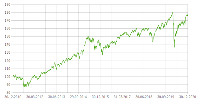
L'andamento negli ultimi dieci anni (*)

(*) L'andamento passato del fondo non è indicativo per il successivo futuro andamento che può quindi differire anche rilevante da questo